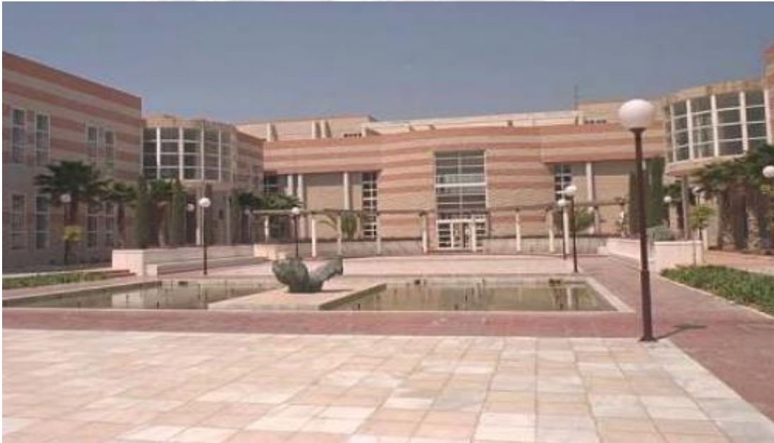
AULARIO GENERAL I (Interior)