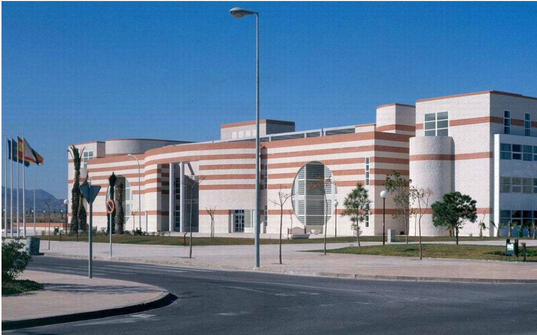
AULARIO GENERAL I (Exterior Sur)