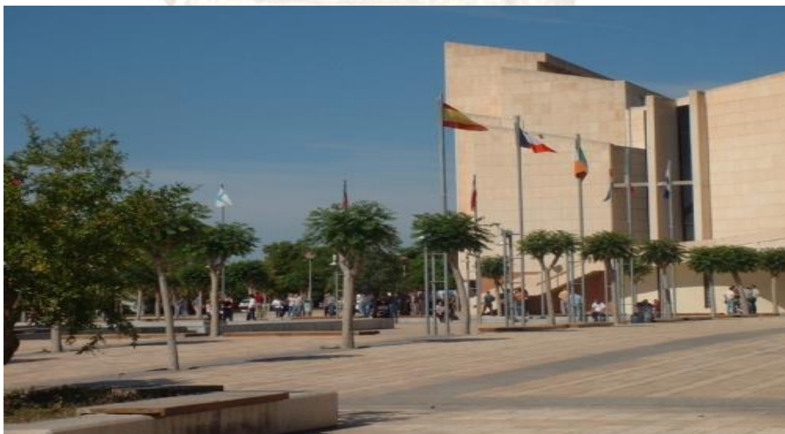
FACULTAD DE DERECHO-PARANINFO